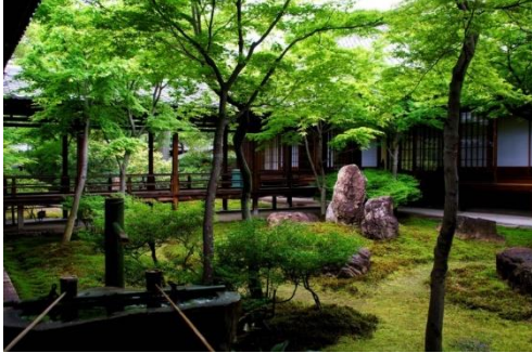
京都祇園・建仁寺の青もみじ

7月 昨日は久しぶりにうつくしい夜空に天の川 織女と牽牛 夏の大三角形みえましたか？ 梅雨はまだ明けませんが 厳しい暑さです。朝8時にはもう30度超え・・・体力温存が合言葉ですね。